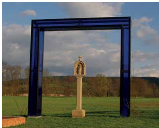
Maria in blauem Tor – Symbol für das Universum und die Symbiose von Alt und Neu (Jimmy Fell, 2010)

herzlich willkommen - unabhängig von ihrer Konfessions- oder Kirchenzugehörigkeit. Mit Respekt und Toleranz wollen wir zuhören und nachdenken – in oder mit christlicher Perspektive.