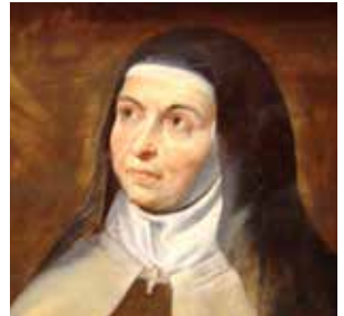
Teresa von Ávila (1515 – 1582)

Ich wage nicht, die Gabe zu erleben, mir die Krankheitsschilderungen anderer mit Freude anzuhören, aber lehre mich, sie geduldig zu ertragen.